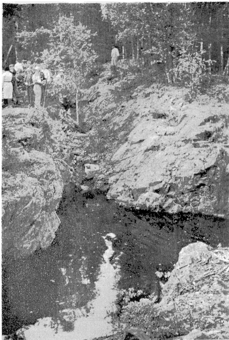
En bild av den numera vattenfyllda 'Kattgruvan' som bearbetades under drottning Christinas tid.