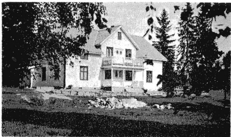
Villan som Pay byggde i Sandviken, numera barnkoloni.